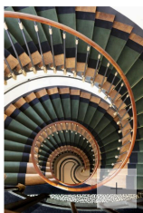
L'escalier en colimaçon. Les Jardins du Faubourg / photo presse

«Colonne vertébrale historique du bâtiment, l'escalier a été restauré dans la pure tradition. Je l'ai simplement habillé d'un tapis, apportant confort visuel et acoustique.»