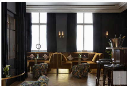
Le bar. Les Jardins du Faubourg

«Il a des allures de boudoir moderne. Ses teintes foncées, sombres, le distinguent volontairement des autres espaces du rez-de-chaussée. Velours, eucalyptus fumé, brèche et lignes d'un mobilier sur-mesure que j'ai également dessiné, font le lien.»