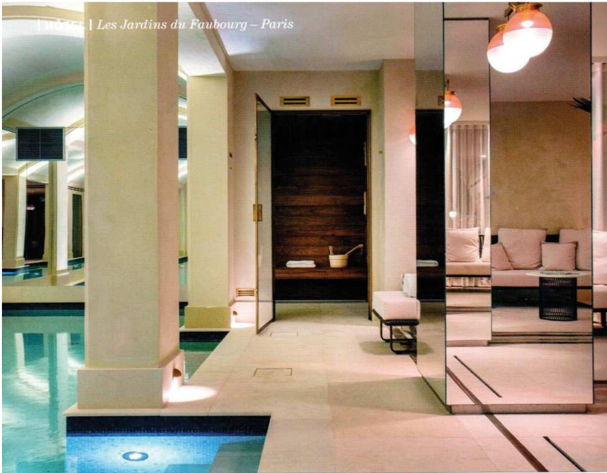
| Les Jardins du Faubourg – Paris